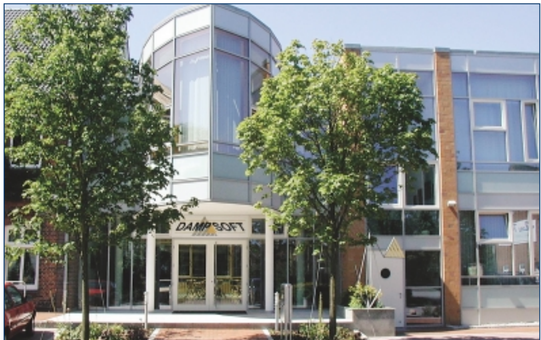
Der Firmensitz von DAMPSOFT im Ostseebad Damp.

Während dieses Prozesses setzten sich die Verantwortlichen von DAMPSOFT zusätzlich mit einem geordneten Qualitätsmanagement-System (DIN EN ISO 9000ff) auseinander und befanden abschließend dieses Werk als wirksame Organisationshilfe und erwirkten eine Integration.